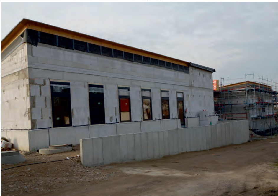
Der Neubau der Kita Leidhecke ist dank Geothermie und Solaranlage ein nahezu Null-Emissionsgebäude, lediglich die Küche braucht einen externen Stromanschluss.

Für alle Gebäude wurde ein ganzheitlicher Maßnahmenplan erstellt, der aus einer Reihe von Einzelmaßnahmen besteht. Dies kann die Erneuerung von Heizanlagen bedeuten. Fast immer heißt dies den Einsatz moderner Gebäudeleittechnik. Dies versetzt uns in die Lage, die Gebäude ferngesteuert nur zu so heizen, wie es dem jeweiligen Nutzungsprofil entspricht. Unabhängig von der aktuellen Mangellage reduziert dies nachhaltig Energiebedarf und Kosten, und ist ein unmittelbarer Beitrag zum Klimaschutz.