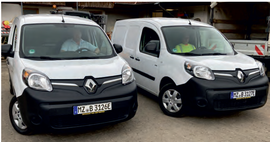
Die neuen Elektro-Kleintransporter der Ortsgemeinde Bodenheim

Mit der Anschaffung von zwei neuen E-Autos trägt die Gemeinde einen weiteren wichtigen Beitrag zum Klimaschutz bei. Denn seit dem zurückliegenden Sommer wird die Arbeit des Gemeinde-Bauhofes und vor allem die Arbeit der Hausmeister mit dem klimaneutralen Mobilitätsgewinn durch die beiden neuen Fahrzeugen