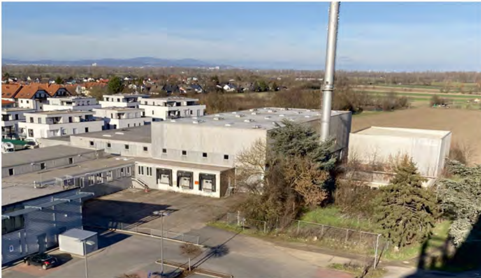
Blick auf das geplante Baugebiet Eichweg-Nord. Nach Abriss der Halle sollen hier neben Eigentumswohnungen auch Platz für bezahlbaren Wohnraum entstehen.

Es gehört zu den strategischen Zielen der SPD-Bodenheim, für alle Bevölkerungs- und Einkommenschichten Wohnraum in unserer Gemeinde anzubieten. Dabei kommt der zukünftigen Bereitstellung von bezahlbarem Wohnraum eine besondere Bedeutung zu. Leider stellt sich heraus, dass die geplante Verbesserung der Wohnraumsituation in der Gemeinde, nicht von allen Fraktionen im Gemeinderat geteilt wird.