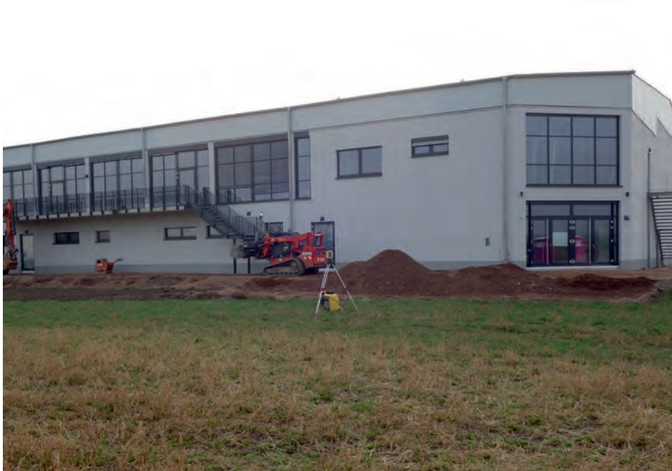
Die neue Sport- und Veranstaltungshalle im „Bürgel“ kann dank Erdwärme und Photovoltaik energetisch autark betrieben werden.

Alle Gebäude der Gemeinde werden mit Photovoltaikanlagen versehen